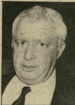
שר-ביטחון שרון גם רצה תינוקות -

...לא רק שרון נתן לפלאג-נות נשק. ציוד וכסף, הוא גם לקח