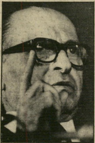
ראש-ממשלה בגין ואזרחים חסרי-תגן

משנסתיימה המלחמה, על הממשלה להורות לצה"ל לעזוב את לבנון - ומיד. כך לא ייפגעו היילנו, ולא נואשם כרוצחים. במקביל לנסיגת צה"ל מלבנון, על ממשלת ישראל לפנות לדעת הקהל בעולם - דרך תינוקות, התיקשורת - ולשכנעו לשלוח