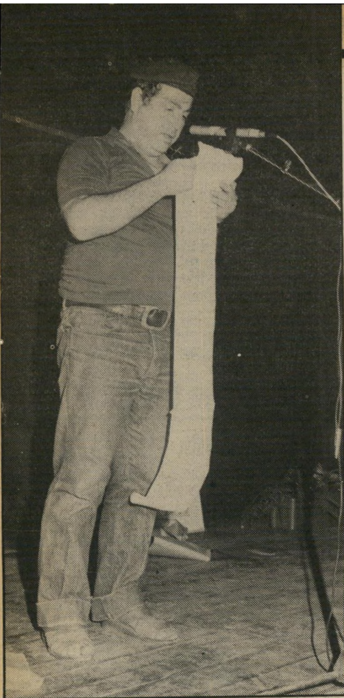
הרמטכ"ל רפול זוכה לחיי קוי מהבדרן טוביה צפיר, שחשב לראשו כומתה שחורה, ובידיו הוא מחזיק כאילו מגילת הלשנה.