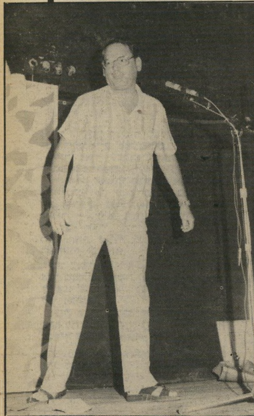
הצולב דם עברון, שתקף את אבשלום קור בתוכניתו זה הזמן, מברך את עובדי התחנה. דם מניש בתחנה תוכנית למוסיקה קלאסית.

דבריו פנה אל, כבוד הרמטכ"ל, כבוד שר-הביטחון, כבוד ראש-הממשלה. דבריו גררו מייד צחוקים, כי הם כלל לא נכחו באולם.