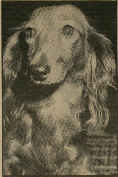
ניל דה'נוביל מוסו