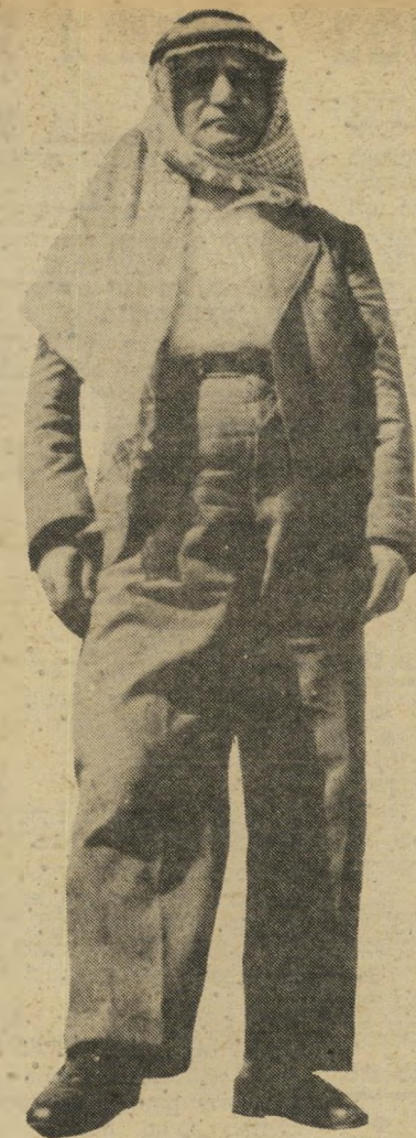
מנחם בן-גוריון* ההיסטוריה ציונות לחיות עם הערבים

אחד מפניני מחרוזת העשייה החלוצית בארץ-ישראל היה זרם העובדים בחינוך. אותה מערכת של בתי-ספר מיוחדים, חד- שניים, המחנכים לערכים, שכוננו בחיי- חינוך, באחד משינוינותיו החליט ראש- הממשלה הראשון של ישראל, דויד בן- גוריון, לבטל את זרם העובדים, למחוק את ערכיו ולהטמיע אותם במערכת הלימודים הממלכתיים — כאשר המבצע היה שר החינוך-התרבות דאן זלמן („זיאמה“) ארן, שהמציא לצורך זה גם את מילת הקסם החלולה „תודעה יהודית“ כתהליך. השנה ראה-אור סיפורו של „שימועון רשף“ זרם העובדים בחינוך — מטרותיה ותולדותיה של תנועה חינוכית בשנים תרפ"א—תרצ"ט. זהו מחקר מעמיק, הברי- חן את ערש מערכת החינוך ההסתדרותי, במהפכה היהודית שעברה על יהודי הגולה והביאה קומץ מהם לארץ-ישראל, במטרה לייסד חברה חדשנית, בעלת ערכים שוויו- ניים, חינוך להגשמה עצמית וליגיע כפיים — כל אותם ערכים שהחברה הישראלית, נכון לעכשיו, מחקה מהלכסיקון. זרם הי- עובדים נועד להיות חינוך לערכים במיס- גרת לא דתית, תוך שמירה על אוטונומיה אידיאולוגית מהרוחות האחרות שגשבו כבר באותה עת בחברה הארצישראלית. זרם העובדים נועד לספק לתנועת העבודה את עתודות כוח-האדם, עתודות של דור הבנים דור הנכדים.