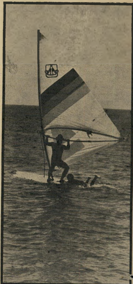
רופא ד"ר ב.ס. חברה של השחי קניית נבי אלדור, גולש עם גלשן ציבעוני, שניתן לשכור בכפר.

מבית החולים בלי עין אחת ועם תעודת נכה, הוא זכה לכינוי "גלסון", על שמו של האדמירל הבריטי שחוסהעין.