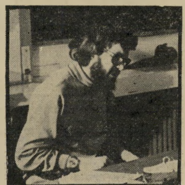
פאטיריקן ב. מיכאל הגיע עת שימצא

זו ארץ זו? הוא ספר של קולקטיב מחברים, שמחבריו נפרדו איש-איש לדרי