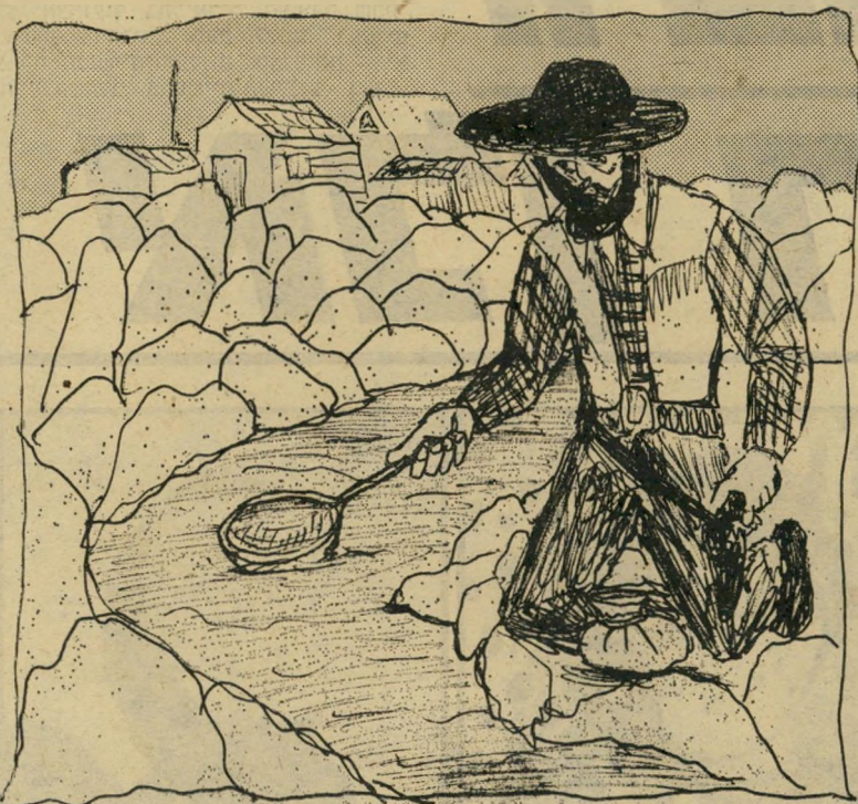
מחפש זהב בקליפורניה ציוני, סוציאליסטי ואהב עמים

האלה, הם עצמם, אותם אידיאליסטים מופלאים, הופכים להיות כנופיית רודפי-בצע, המסנים וסחטנים, השודדים את העם וגוזלים להם מפי הטף. לכאורה, זה לא יכול להסתדר ביחד. אבל דווקא כן. זה מסתדר יפה. את המפתח להסבר נתן (איך לא?) הפרופסור יובל גאמן, המנהיג החצי-זמטי