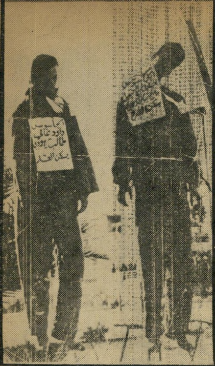
האח (מימין) אחרי תלייתו. אמרו שהוא מרגל ציוני

אחרי שנרצח בעלה, ובמשך כל הזמן הוא התעללו בה החוטפים.