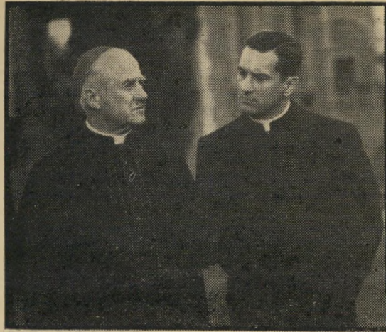
דה-נירו וסיריל קוזאק: מאופק להפליא

הזאת יותר ממימד שטחי, ומה שמור יותר, הוא אינו מקנה לכל המיבנה שלו קצב קולנועי של ממש. הסיפור נמשך ונמשך זמן רב אחרי שהתיזה שלו ברורה לגמרי. לכל אורכו נידמה כי עתיד לבוא היא עוצר נשימה שאינו מגיע. זאת ועוד, השרירותיות של התפתחות העלילה, שבה דמויות מתחסלות כדי להקל על מלאכת הכותבים וה-בימאי, אינה עוזרת הרבה.