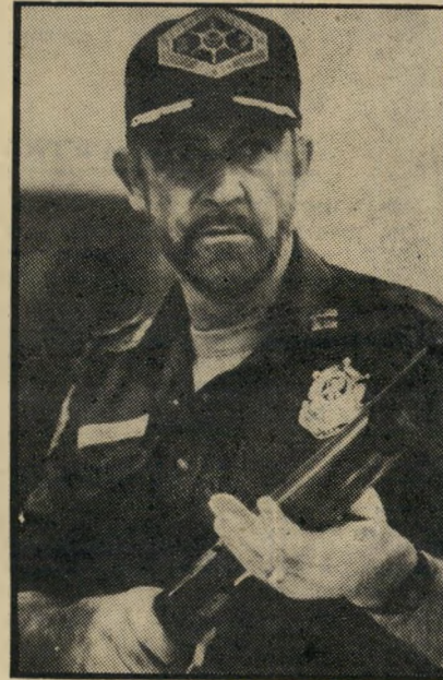
שון קונרי בפעולה שריף בודד

יש כמובן מי שיאמר, כי בתנאים שבהם הוא עובד כיום, קשה לצפות שמשוה ישתנה: בלמונדו מעורב בתהליך היצירה של סרטים משלב מוקדם, דורש תסריטים תפורים לפי מידה ואף מקבל אותם. עד כמה התהליך הזה עוזר לאמנות, זאת אין