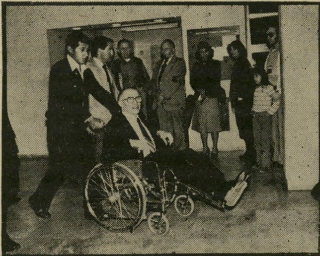
מנחם בגין ידיות באמבטיה מאגד

י חיאל קדישאני, ראש-לישכת ראש-הממשלה, התבקש לאשר את הידיעה על הסתייעות מישפט בגין באירגון יד שרה. הוא התקשר עם עליזה בגין, המאושר פוזת בבית-החולים, והיא ביקשה ממנו לאשר את הפרטים. היא גם ביקשה שהעולם הזה יתקשר עם אבי שטרן מאירגון יד שרה ויקבל