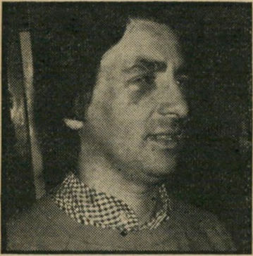
בימאי טלוויזיה סלפון פנס בעין

היום? אנחנו לא מספיק טובים להיות מישחק מרכזי? למה דווקא בבלומפילד?