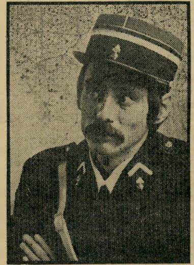
ויקטור אנרי דה-יוז' אנט'שמיות מתחילת המאה

הירהור מוזר זה עלה במוחי, משום שבימים אלה שיגר אלי חבר שנמצא בפאריס מיסמך מעניין מאוד. אותו חבר יושב לו בסיפריית "הסורבון", ודולה