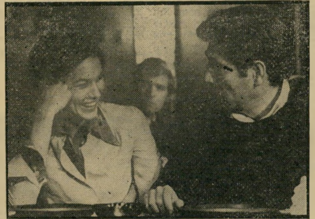
סגל: רוקטה רוסית יום רביעי, שעה 10.05

סדרה לידדים ולי נוער: היידי בת ההרים (3.00) - שידור בצבע, דימוז עברי. הפרק השיבה הביחה. לקלרה קשה הפרידה מהידי ואביה מסביר לה שגיי