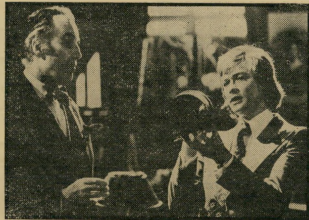
לי וורד: אורפון וולם מוצאי-שבת, שעה 11.20

סידרה: יידי דעת צרה (6.02) - שידור כי צבע, מדבר אנגלית. בפרק תיקון טעות עוד אחת מעלילותיו של כלב הטלוויזיה המופלא, המסייע לאנשים שור גים ברחבי ארצות-הברית. הי פעם משחרר הכלב רקדנית הנחטפת מטעמים פוליטיים. דת: דינים, מינהי גים ושירים לחנוכה (8.00) - שחור-לבן. תוכנית ל-