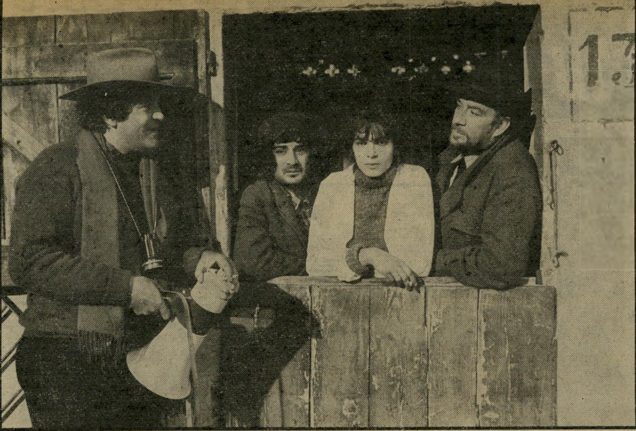
בימאי ברנארדו ברטולוצ'י (משמאל) מביים את „טרנדיה של אדם מגוחך“ אינו אומר מאומה על שום-דבר

מי שזוכר את סרטיו הראשונים של ברטולוצ'י נוטה להאמין בהנחה הראשונה. תימרונות המציאות והאגדה בסרט כמו אסטרוגיה של עכביש, הפאסזים הוחל לשילטון באין מפריע, בקונפורמיסטי, נוסטלגית תור הזהב המדומה שבלפני המהפיכה — כל אלה הצביעו על יכולת ביטוי קולנועית ניכרת, יחד עם שימוש מעניין בתורותיהם של מארכס ופרויד גם יחד.