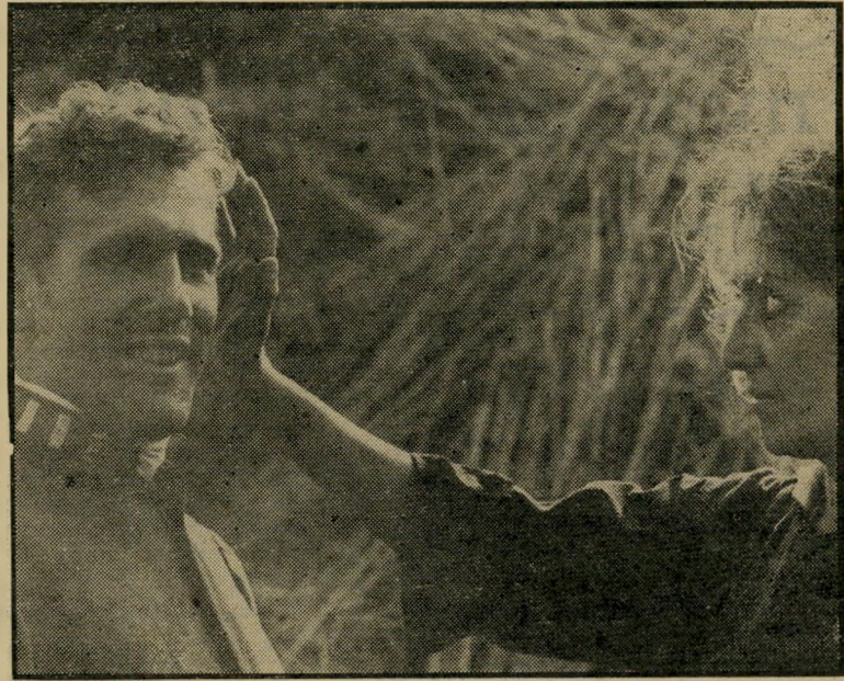
שחקן ז'ראר דפארדייה ב„1900“ של ברטולוצ'י דיאלקטיקה פוליטית שקופה

רומנטי למילחמה במימסד, נוסח רובין הוד במאה ה-20, וכדי שלא להתחייב בשום נושא, הם מוצאים לעצמם מיפלט בתוך עולם של תיאוריות והכרזות רע-שניות, המלוות בכל צבעי הקשת של האסתטיקה. יש להניח שרווי צודק, אבל, גם אם מה שעומד מאחורי המרדנים הללו הינו