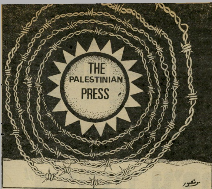
הכרזה שנשארה בהפגנה נגד סגירת "אריפג'י" העתונות הפלסטינית במצור

עם בחירת מוכ"ל מיפגת העבור דה נגמרו ההתכתשויות הפנימיות ויש להיערך ליציאה לדרך העם והמדינה. במערכת הבחירות נגזרה תוכנית הסוציאליזם מחשש לבריחת השכבות המתעשרות מד"ש לשע" בר, ורווח זה יצא בהפסד השכבות החלשות, שנחפזו לליכוד. תנועת העבודה צריכה לבצע בתחומי הי הסתדרות המצוייה בשליטתה את הסוציאליזם (נוסח ישראל) — עכ" שיו. בלי פיקפוקים ובלי התחכמי מויות, ולא לפי דוגמות ממדינות אחרות.