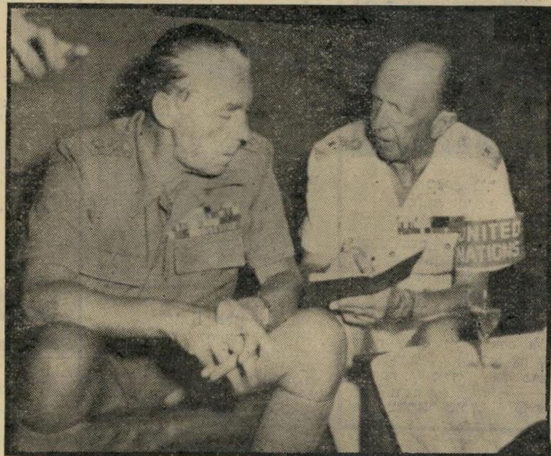
הרוזן ברנאדוט (משמאל) עם עוזרו בירושלים זכויות רוחניות בירושלים

"עיתונים מדווחים על שתי אוניות שעזבו את מארסי עם עולים צעירים ונשק. עלינו להמשיך ולשמור על קיומה של הפסקת האש ותנאיה, אחרת נואשם בהסגת החוק הבינלאומי. דבר זה יזיק למצבנו הכללי, אני משוכנע שאתה תדאג להתנהגות הולמת של כל נציגינו בכל מקום. חיים וייצמן." ביוני 1948, ירשה ברודוס ממשלת ישראל בראשותו של ראובן שילוח, וניהלה משאומתן עם מותחן האו"ם למזרח-התיכון, הרוזן פולקה ברנדוט.