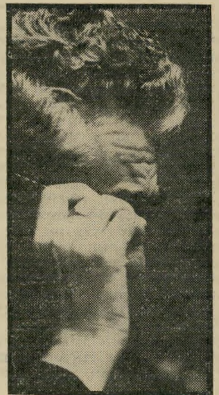
יו"ר יפת חזית אחידה

השקעות בקניית חברות. הביטוח ארוט קונה את הסנה, אוסם קונה את פרומין וכי, עיס קות אלה בתהליך המונופוליוזיה, מקיימות את שער-הריבית הגבוה. האשראי הבנקאי ניתן לחברות גדולות שמסוגלות לעמוד במחיר, וכדאי להן לקבל את האשראי. החברות האלה קונות את המוכן, אין כאן סיכון, אין זמן שדרוש להבשלת ההשקעה, אך אין גם