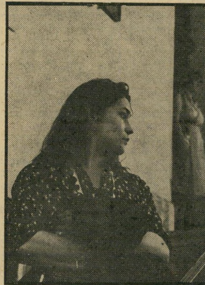
אנג'ל בתפקיד הפליטה היהודיה העמדת-פנים נכשלת

רציית להראות ששווייץ אינה אותו גן-עדן עלי אדמות שמצטייר בעיני רבים, הסביר אימהוף כאשר הציג את