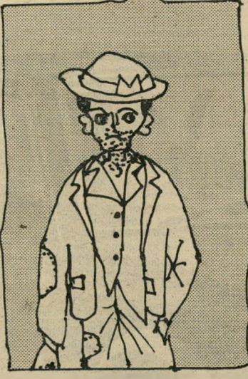
עני אמיתי 7 ק 200

וביגלל שזה בדיוק מה שאני חושב, כלידך מצא-חן בעיני מאמר שכתב הפרשן הכלכלי של עיתון "הארץ", אברהם טל, תחת הכותרת "כיצד נוספו רבבות עניים". אברהם טל בטח חושב כמוני, אבל לא מסביר את מחשבותיו בצורה כלידך וולגארית כמו שאני עשית-כאן, אבל בשפה יפה, כמו שרק נרשן לכלכלי יכול.