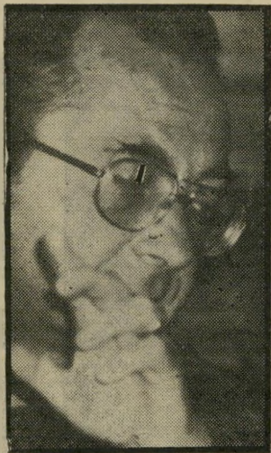
מפכיר ארנס ניגוד אינטרסים

בדיעבד קראו לכך בירושלים פליטת-פה, אך הנסיבות שבהן אמר פרופסור משה ארנס, יושב-ראש ועדת-החוקי-הביטחון של