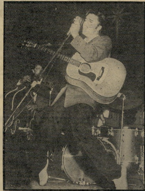
אליז זמר פרסלי כמו בהוליווד

בית-המשפט בממפיס הורה על פתיחת חקירה פלילית נגד פארקר. הוא הואשם בניצול מחלתו של אלווין