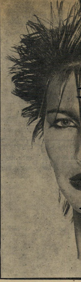
מאוד אופנתית בקיץ, אינה שיהייער קצת ארוך, עוזר לנו חום אדמדם וחום אפרפר.

מה פיתאום? אצלנו נתונים לו לצאת, ועוד איך. פשוט מבקשים ממנו לצאת, כל-כך רוצים שייצא, שאם הוא בעצמו לא מוכן לצאת, פשוט מוציאים אותו, ואחר-כך מתפלאים שהוא נושא נאומים אנטי-ישראלים בניו-יורק! עם כל הכבוד לסובייטים ולנסינים הארוך בשדה השילטון והמימשל, כדאי להם ללמוד מהנו גם מאיתנו, הקטנים. מה שטוב לפאהד קוואסמה, טוב גם לאלכסנדר פריצקי.