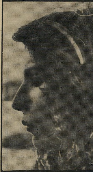
נש כפול היא התסרו-קת המובר-י 82, דבל פרמנט' בספה גלי למעלה ומסולסל בקצוות.

ר השיער עבה, מתקבל נפח לתשתלט עליי. אפקט זה, מגלגלים ביגודים ססירליים מיוחדים, ספרי גלי השיער הרטוב, וכך יוצר גלגלים. היתרון בתסרוקת זו גול הוא חד-פעמי. לאחר מכן י ולייבש את השיער באופן בוקים אינם מאבדים את צור-שישה עד שמונה חודשים. ששה מסודרת לעונה שלמה, ספרות וחוסכת זמן רב. חסי-רמת לאשה להיראות נשית, בבשה ורומנטית בעת ובעונה השיער-החלק, החוששות - אינן רוצות לסלסלו בפרמנט-פיתרון, והוא המישחק באביי