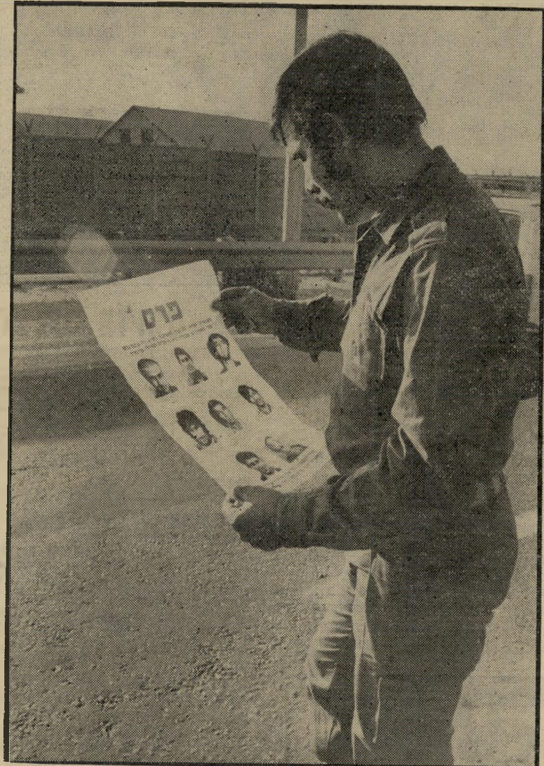
שוטר מישמר-הגבול וכרזת הפרם „הרגשתי שהתאהבתי...“