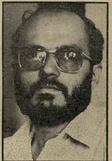
פרקדיט יודי ללא תמורה כספית