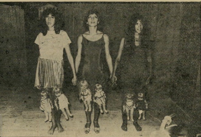
מאזנתרות פולן, קנטר ודני שחקה יעבוד קצת

המחזאי ריצ'ארד פורמן הוא בעל תיאטרון בניו־יורק. פורמן הוא מ־ המחזאים הראשונים שניסו לשבור את המיסגרת השיגרתית ואת מי־ נה ההצגה. הוא נטש את המיסגרת העלילתית, בעלת הקו ההמשכי והחוט ששורר את העלילה עד ל־ סיומה המפתיע, לטובת תיאטרון של אסוציאציות. במחזה שלו אין המשכיות. יש מיסגרת עלילתית, אך אין סיפור מעשה. מי שעושה את עבודת הקישור הוא הצופה. דימיון ומחש. יש במחזה הר־ בה וולגאריות. יש עירום, לפעמים עדין ולפעמים ברוטאלי. השחקנים נדרשים לעבודת מישחק קשה ו־