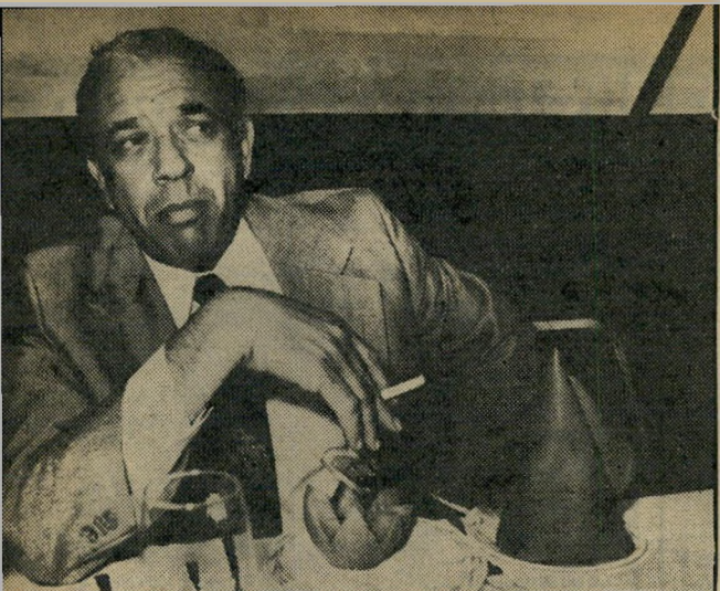
יושבי-ראש שביט חרט מודעות

מוקים טכניים. הם טענו שמשום שאל-על נתן פירסום להגשת ה' תלונות, עוד לפני שהן נבדקו, אסור לה, לוועדה, לדון בתלונות. אך כשהבינו נציגי הארץ שטענה זו לא תתקבל, לא חזרו עליה. ב-28 בדצמבר פירסם חדר ידי' עה לפיה מקבלת אל-על סובסידיה ממינהל הדלק, עבור הדלק שהיא רוכשת למטוסייה. ידיעה זו גרמה נזק רב לאל-על, משום שחברות-התעופה האחרות הפעילו לחצים להסיר את הסוב' סידיה מאל-על. לטענת החברה היא