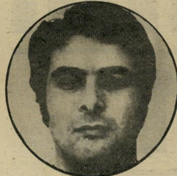
אסיר אבו הנשיא לא ידע