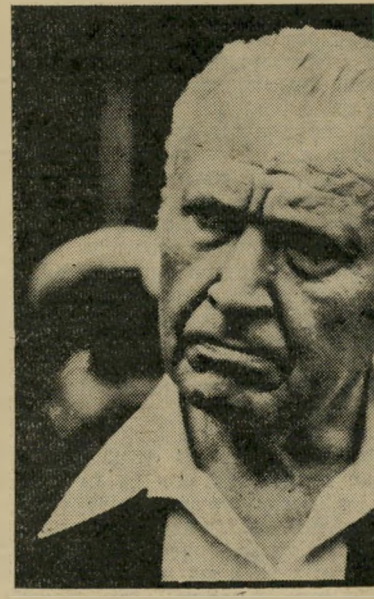
נשיא לשעבר קציר בגין מעל הנשיא