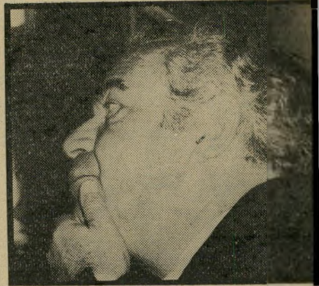
שר-המישפטים לשעבר תמיר נוקשות

העונש במלואו, יתעברו נסיבות ושיקולים חדשים: התנהגות הנידון בזמן ריצוי העונש, שינויים בעמדתו החברתית ומצבו האישי או המישפחתי, שינויים באפשרויות יותיו החומריות או ביכולתו הפיזית לשאת את העונש או להמשיך בנושאתו, שינויים בהשקפת החברה עצמה על חומרת הרעוע שבוצע וכיוצאים באלה. גורמים ושיקולים אחרים העשויים להצריך ולהצדיק התאמה מתודשת של האחריות הפלילית שנקבעה סופית על-ידי הרשות השופטת.