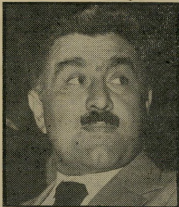
שר-המישפטים ניסים העלמה

ובפרקליטות, הופכת כל חקירה וכל מישר פט לעניין אישי של החוקרים ושל הרעועים. הם יודעים שקידומם בדרגה אינו תלוי בכך אם עזרו לעשות צדק, אלא אם הצליחו להשיג הרשעה. לאותם אנשים, שאחרי חקירה או מישרפוט, שבהם הם היו להוטים להכניס את האסיר מאחרי סורג ובריה, קבעו את יחסם אל מי שהיה נאשם והיום אסיר, ניתן שיקול-דעת אם להעניק לו חנינה או לא. גם לאנשים בעלי נפש גדולה מהמקובל אצל השוטרים ותובעיה-הפרקליטות, קשה להתעלות מעל עצמם במצב כזה. בשנים האחרונות התפרסמו לפחות ארבעה מיקרים של חנינה או של אי-מתן חנינה.