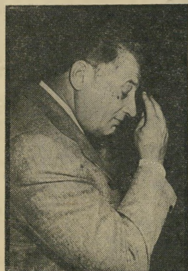
נשיא שניצר צריך להתפלל

אפילו נשיא בורסת-היהלומים, משה שניצר אומר: "כל תפילותינו ומאוויינו הם לצורך על-פני המים ולהחזיק מעמד". הבנקים לא אומרים. הם לוצים על היהלומנים להחזיר חובות ומהר. לעומתם אומר גזעון פת, שר התעשייה וה"מיסחר: "מדיניות מישרדי היא להקטין את הסיוע לסוחר היהלומים. מעתה לא יהיה כדאי יותר ליהלומנים לעשות מעין מניפולציות של ייצוא לחברות ה"קשורות בהם. לסיכום: המצב גרוע.