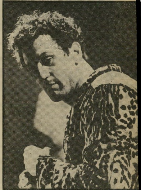
רוברט דה-נירו להחליף אישיות

אשר לחיק המישפחה, אמריקה החליטה לשוב ולהתעניין בו אחרי שנים ארוכות