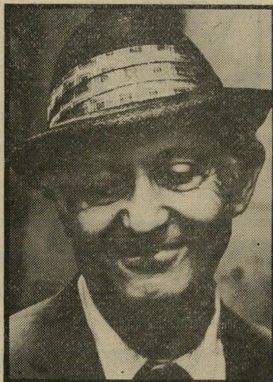
לי שטראסבורג זקנים