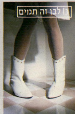
[3] לבן זה תמיים

מלאך קטן. ממוש נשמה טובה. תמימה, ביישנית, עם משיכה חזקה לפינות. תמיד תמיד במגפיים לבנים.