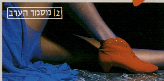
[2] מסמר הערב

לא עושה חשבון לאף אחד. אדום ומבריק זה הסגנון. מצידה, שכל הנעל תהיה משובצת כוכבים. כדאי להזרז מהשפיץ שלה.