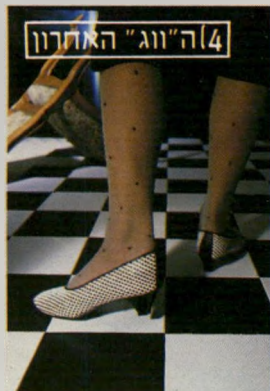
[4] ה"ווג" האחרון

סולידית ואלגנטית, הליידי. בנעלי נושבוט שחור לבן ועקב פיקולו דוגמת פריז ורומא.