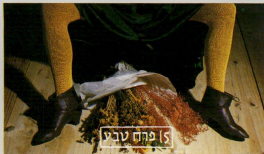
[5] פקה טבע

מלאך קטן. ממוש נשמה טובה. תמימה, ביישנית, עם משיכה חזקה לפינות. תמיד תמיד במגפיים לבנים.