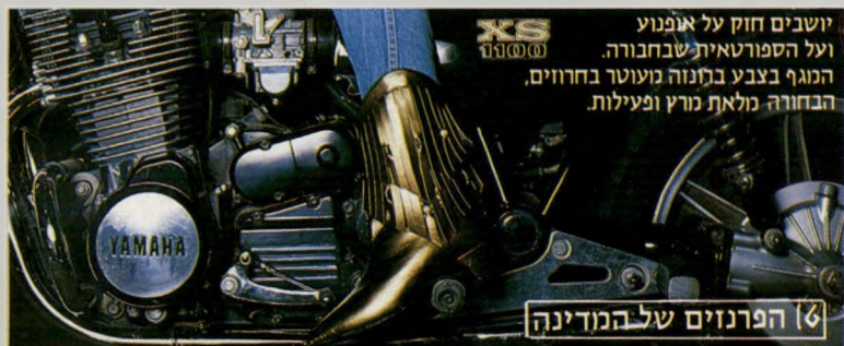
[6] הפרנזים של המדינה

חופשייה, טבעית, מתרחקת מוקסמים. מחוזה עם הצבעים השולטים בטבע: שמלה ירוקה ומגפון חום עם צווארון מעוטר בשווד.