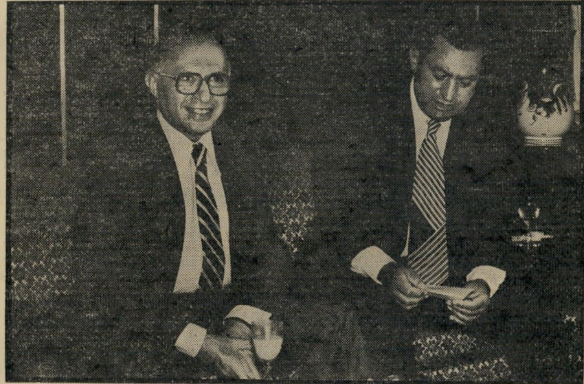
נשיא וראש־ממשלה חוסני מוברק ומנחם בגין

הזדמנות לבלות במחיצת רעייתו ושני ילדיו. למרות היותו איש מישפחה חם, הוא תקיף גם בביתו ודעתו היא הקר־ בעת. כשרצתה סוזי ללמוד פסיכולוגיה, עמד על כך מוברק שהיא תלמד מדע־ המדינה באוניברסיטה האמריקאית. סוזי מוברק למדה מדע־המדינה, מקצוע שב־ וודאי ישרת אותה עכשיו כאשת הנשיא. לשרותו של חוסני מוברק כסגן ה־ נשיא שני מאפיינים, השונים והסותרים לכאורה זה את זה. מצד אחד הוא הק־ פיד להיות תמיד בצילו של סאדאת,