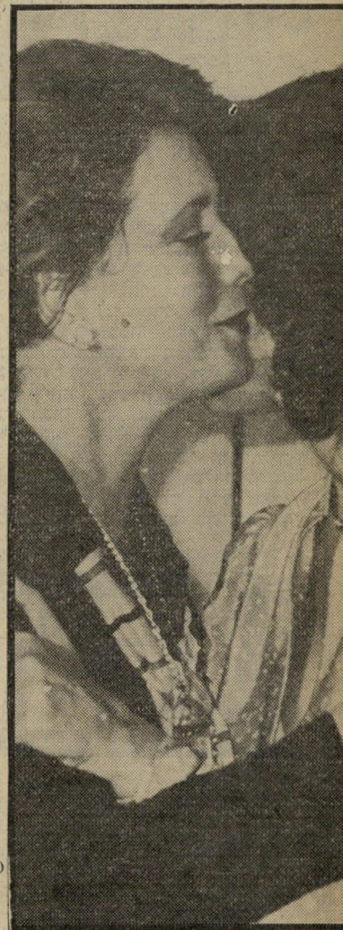
אופירה נבון וג'יהאן סאדאת שתי נשיאות

אכנרי: זה היה דבר שלא-אייאמן. אבל הרגע המרגש ביותר אירע כשבעלך ביקר במיסגד אליאקצה. אני רוחש כבוד רב לאנשים בעלי אומץ-לב פסי. הוא כרע שם בשורה הראשונה, כשמאות פלסטינים מאחוריו. כל אחד מהם היה יכול להיות חבר באירגון פדאי. אבל בעלך לא הסב את ראשו לאחור אפילו פעם אחת. הבטתי בפניו, ואפילו כשקמה מהר מה קלה מאחוריו הוא לא הביט לאחור. אני חייב לומר שכבר ראיתי אנשים מפי גינים אומץ-לב, אבל דבר כזה עדיין לא