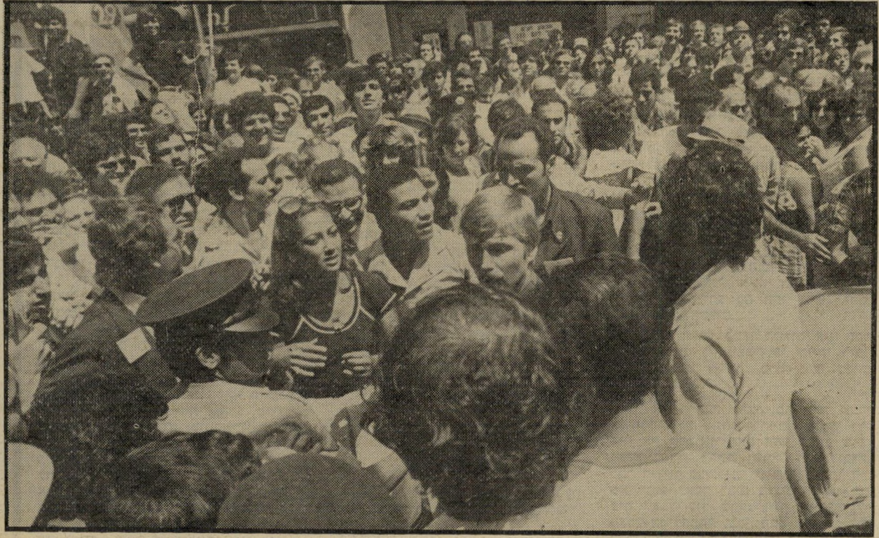
ג'יהאן סאדאת בין מעריצים ישראלים בסיור שערכה בחיפה