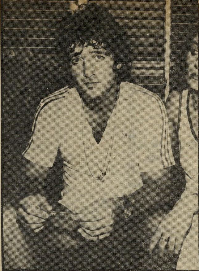
קורא אוהיון הדרכון לא נגנב