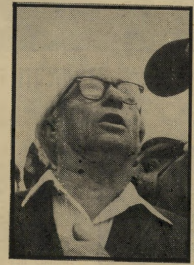
אריאזרד אדרת ודורו

תלמידי תנועות-החינוך חונכו על כך ש, 'צינונות' ו'הגשמה' פירושן התנחלות בגדה המערבית וברצועת-עזה. הם למדו בשיעורי-מחנך שמיכתב השמיניסטים, ש'נשלח לפני כעשר שנים לגולדה מאיר, את תופעה של בגידה. יותר ויותר חיילי צה"ל בילו את כל שירותם הצבאי כחילי כיבוש — והמערכת החינוכית הכשירה אותם לכך היטב. לתהליך זה כימעט שלא היו נוגדנים מעברו השני של המיתרס הפוליטי. היו אלה תנועות-החינוך החלוציות, השמאליות לכאורה, שהינכו את אנשיהן להליכה להתנחלות בקיבוצים החדשים בפיתחת-רפיח. ברמת הגולן וכ' ביקעת הירדן, השמאל שמהוץ למערך היה תולד כוח כימעט לחלוטין. וירק"ח