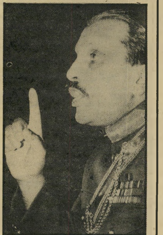
נשיא פקיסתאן זיא א-לי-חאק לקראת הבחירות לכנסת ה־11?

העיתונות העולמית מדוחת מדי יום על פעילות גרעינית נמרצת בפקיסתאן. הנשיא רונאלד רגן תודה, שארצות-הברית מסייעת לפקיסתאן בנושא זה, מטעמים של מדיניות גלובאלית. פקיסתאן משתפת פעולה גם עם חברות קנדיות, צרפתיות, ומקבלת עזרה ניכרת מלוב. נאמו של נשיא עיראק, סאדאם חוסיין, מצביע על נחישות החלטה ערבית להשיג פצצה בכל מחיר, ולא דווקא בדרך של ייצור מקומי. אם בחר מנחה בגין בדרך של אי-שפיות כשיטה מדינית, המסקנות ברורות. המטרה היא עתה פקיסתאן.