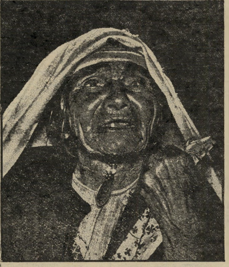
פליטה פלסטינית מצור החול במדינות-ערב, פירסם העולם הזה כתבה על הנעשה בלבנון. פליטה זקנה זו, שברחה מפלסטיין, התגוררה ביחד עם עוד 80 אף פליטים במחנה-הפליטים של צור.