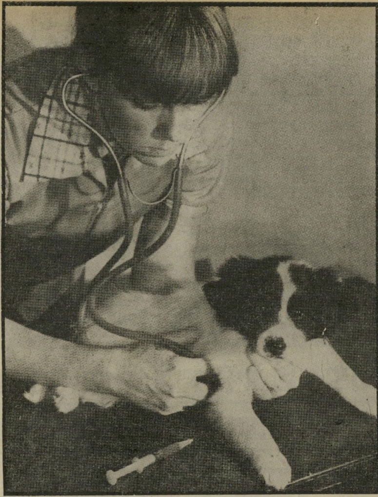
הקיץ הגיע — הקדם תרופה למכה כדאי לחסן כל כלב מדי שישה חודשים