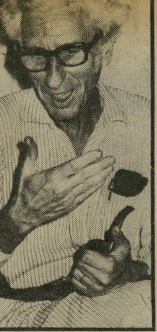
רקף הלינגר לא כשוויץ ישראל