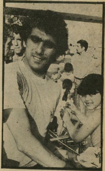
כדורגלן שום מנעים מעבר-לים

יש האומרים שאלמוג לא הופיע מתוך חשש לתגובות נזעמות של אנשי הפועל. אלה טוענים שהוא הגורם העיקרי להחלטה לקיים מישחק חוזר בין הפועל תל-אביב