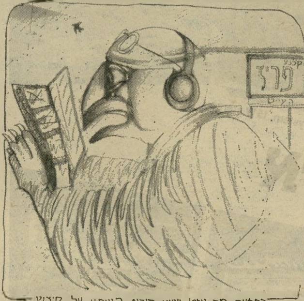
בתמונה: חר עייט יושע קורא בעיתון על קיצוץ כנפיו ואולר בלביבו. ובלות, וראה עוד מי' יאכל את מי'!

"הם עטים עליו בהמוני חס, כמו לחקת נשרים זבי