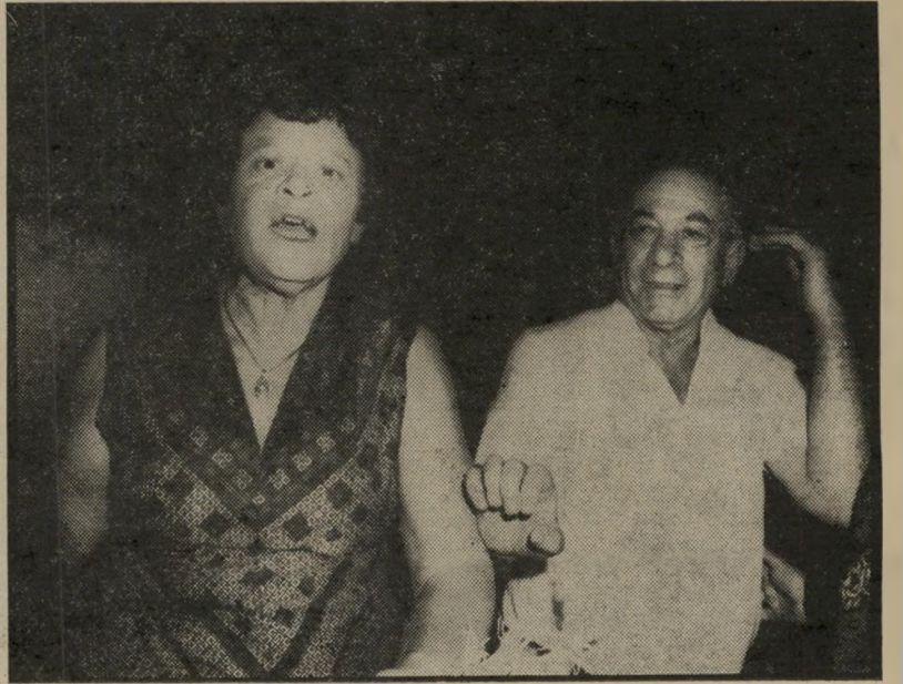
עם אשתו — צעקות ואימים

היה הורביץ לתקוף את הגורם האינפי-לציוני של הכלכלה הישראלית — תקציב הביטחון. שהרי תקציב זה, פלוס החזרי-חובות על חשבון תקציב-ביטחון משנים קודמות, פלוס תקציבי אדי-הוק ממישרדים ממשלתיים למשימות בשטחים הכבושים — החל מקניית קרקעות ועד הקמת התנח-לויות — עולים למשק כשני-שלישים מ"תקציב המדינה. זהו מצב בלתי נסבל, המוליד בשיטתיות אינפלציה גבוהה. כמות המועסקים בתחום הביטחון על גווניו הי-שונים, מגיעה לכדי 25 אחוזים מכלל המועסקים במשק; ואלה אינם מייצרים דבר, אך צורכים כמו כל אחד אחר. כלומר, על כל שלושה המייצרים דבר-מה, יש ארבעה צרכנים. ברור שלא-אינפלציה ב"ש-ראל יש סיבות נוספות, שהן מנת חלקו של כל העולם המערבי, אך אי-אפשר להתעלם מהמרכיב הייחודי הגורם לא-פלציה גבוהה בישראל — תקציב הביט-