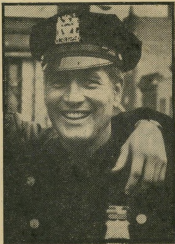
ניומן בתפקיד השוטרי מורפי לוקחים לו את הנעליים

מה שיש ב"רובע הברונקס" הוא רק חלק מן התוויות הפרטיות שלהם. באמתחתם סיפורים לעוד תריסר סרטים, כך לפחות הם טוענים, ואם יקבלו עבורם את התמורה המקווה בדולרים מרששים, הם יקנו מהר כרטיס-טיסה ויברחו לבא"ה האמה. "רחוק ככל האפשר מברונקס", הם מסבירים.