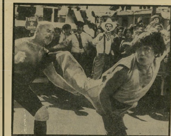
ג'קי צ'אן: יורשו של ברוס לי

הסרט לא תבינו הרבה יותר. אנשים הולכים בו לעשות משהו, אבל הסרט שוכח לומר אם הגיעו אייפעס. דמיון יות מופיעות ונעלמות לפי הצורך ולא לפי העלילה. סקי-נים שממלאים כיכר שלמה, כדי לראות התגוששות ראווה תנית, לא יילכו בעיקבות המתגוששים לתוך אולם קולנוע ריק, פשוט משום שהדבר אינו מסתדר לבמאי. למען האמת, זה נראה כאילו כאן הוסרט סרט ארוך ומפורט הרבה יותר, אבל כשהוחלט להביא אותו לממדים מיס-חריים, העדיפו להוציא את קיטעי העלילה, כדי להשיג איר את המכות בשלמותן. צריך להודות שהמכות הן אמנם משעשעות מאוד, בעיקר כאשר צ'אן קטן-הקומה מכה בנוש-יבשר ענקיים ביעילות של צרעה המחסתלת דובים. מי שאינו מבקש יותר, יבוא על סיפוקו המלא.