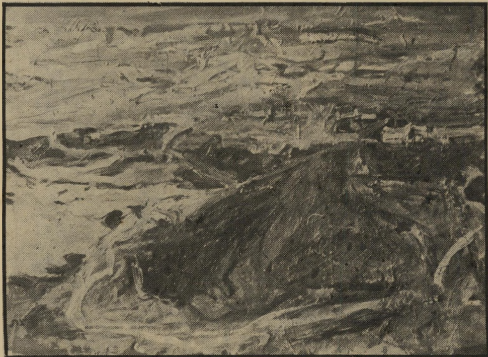
נוף הררי של הצייר אליהו גת כוח צבעוני רב עוצמה

לא בגת ולא באשקלון, לא בביקעה ולא במישור מוצא הצייר הוותיק והמעולה אליהו גת את נושאי ציוריו. תערוכתו החודשה, שבגלריה בית לייזיק, בתל-אביב, מזמנת לאוהבי הציור האימפרסיוני