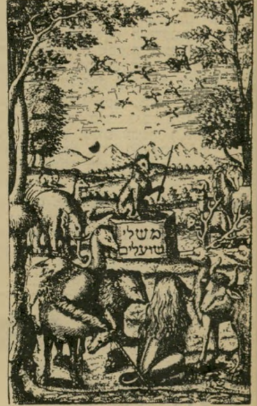
צורה זו — שעה הספר משלו שועלים