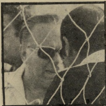
מאמן שוויצ'ר רבע מיליון לירות

הכדורגל מרכז סביבו סכומים אדירים של כסף. הפועל תל-אביב, למשל, תוציא סכום גדול עבור הזכייה באליפות. השח' קנים יקבלו מענקים של 200,000 לירות עד 500,000 לירות כל אחד. אלה הם מענקים מיוחדים עבור הזכייה באליפות. מלבד זאת יקבל כל אחד מהם סכום נוסף, של 40,000 לירות כל אחד, על-פי החוזה שלהם עם האגודה. החוזה מזכיר בעצם סכום של 18,000 לירות לכל שחקן, אבל אחרי המתנה ממושכת של 12 שנה