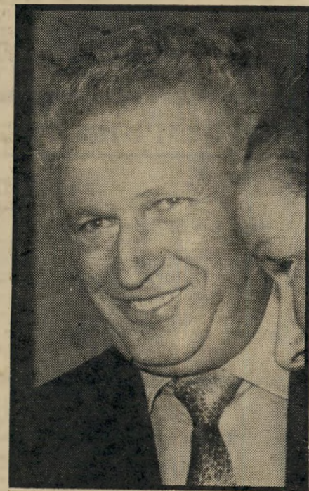
שופט־שלום שלו ביזיון בית־המשפט

— האחת על־ידי בן מיטפחה והשניה בידי ניצח עצמה. כאשר התברר לשופט שלו כי גם הפעם, למרות שתי הזמנות החתומות כדיון, לא הופיעה העדה, הוא חרג ממינהגו הרגיל,