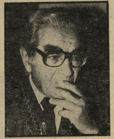
יו"ר סוכנות דוצ'ין לחתום מהר

ראשי הסוכנות לא הבינו את התרגיל של שחל-מרידור, או שהבינו אותו והסיימו. על-פי ההסכם בין הסוכנות למרידור ישלם מרידור רק סכום של 800 אלף דולאר עם הקנייה. מיליון דולאר נוסף עבור חודש, 6.5 מיליון דולאר תוך שנה ואת העודף, בגובה של 1.5