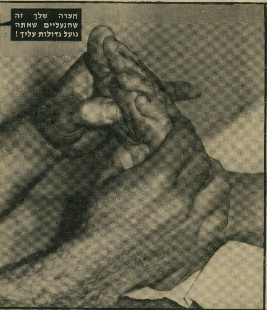
הצרה שלך זה שהנעלים שאתה נועל גדולות עליך!