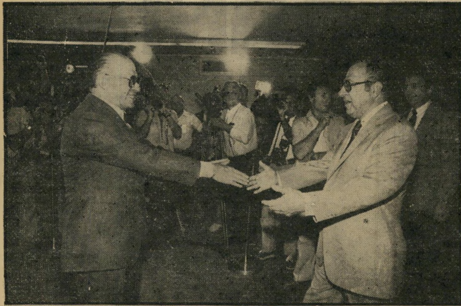
פיליפ חביב נציגו של הנשיא האמריקאי, רונלד רגן, שבא למסע דילוגים במזרח התיכון בגלל משבר הטילים, פגש בראשי-הממשלה מנחם בגין, כשמסביבם עיתונאים וצלמים מכל רחבי העולם. בפגישה הראשונה בין השניים נראה כאילו הם יוצאים בריקוד.