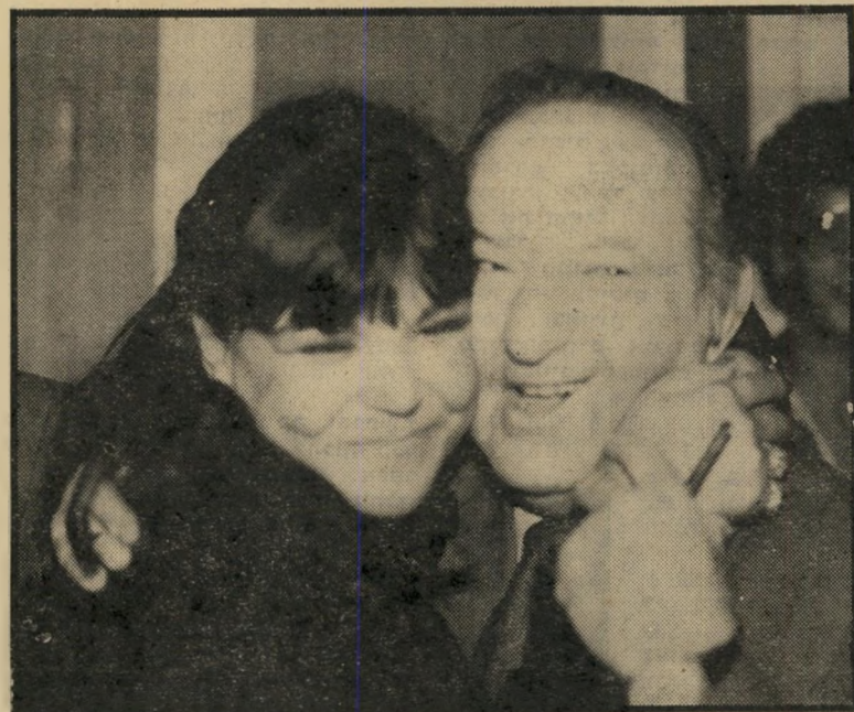
השר כץ עם עליזה עזיקרי "בעניינים סוציאליים"

הדוקטור לעבודה סוציאלית, שסדבר בתחום עיסוקו, שמר בדרך-כלל על פרויפיל פוליטי נמוך. אומנם בשנת 1965 הוא חיבר את המצע החברתי של רפ"י, שהתמודדה אז בבחירות, אך לזירה עצמה זינק רק ב-1973, כאשר התפטר מתפקידו המגוונים והתכוון להיכלל ברשימת ה-מערך, על-פי עצת משה דיין. לבסוף נזח את הרעיון ופנה למחקר. רק בשנת 1977